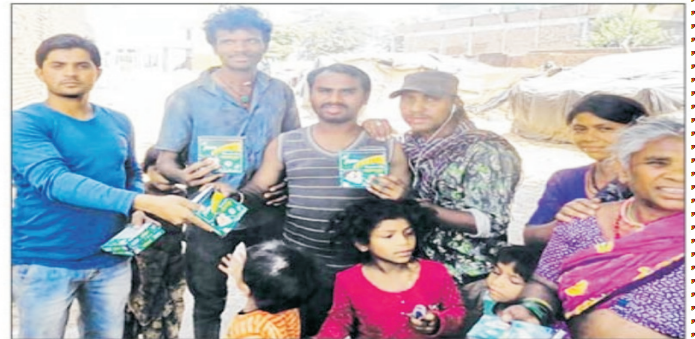
ਸੰਸਥਾ ਦੇ ਵਲੰਟੀਅਰ ਮੱਛਰ ਮਾਰਨ ਵਾਲੇ ਮੈਸਕੀਟੋ ਕੁਆਇਲ ਸਲੱਮ ਇਲਾਕੇ 'ਚ ਵੰਡਦੇ ਹੋਏ।