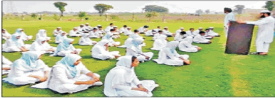
मालेरकोटला के आबान स्कूल में वोट के अधिकार की जानकारी देते प्रतिनिधि।

गई है, इसलिए हर विद्यार्थी जिसकी आयु 1 जनवरी 2017 को 18 वर्ष हो जाएगी, वह अपनी वोट जरूर बनाए व वोट का सही उपयोग करे, क्योंकि अब तक नौजवानों को सामाजिक व कानूनी अधिकार ही मिले हैं, लेकिन वोट केवल 0.4 प्रतिशत नौजवानों की ही बनी है। इस दायरे को कम करने की जरूरत है। 18 वर्ष से अधिक आयु के नौजवानों की 11 लाख 50 हजार वोट बननी चाहिए, लेकिन 9 लाख 5 हजार वोट ही बनी है। अंत में स्कूल में 18 वर्ष के बच्चों ने प्रण लिया कि वह जल्द से जल्द अपनी वोट बनावाएंगे।