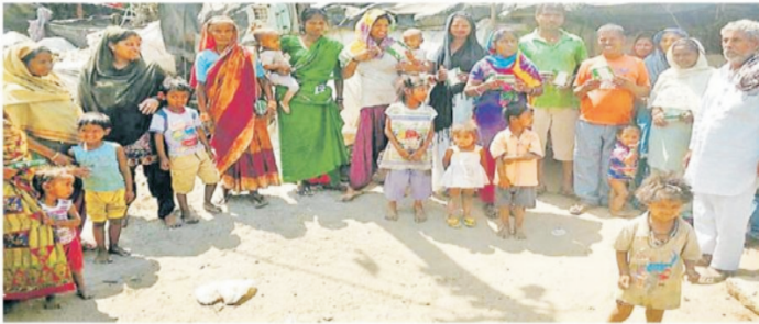
ਮਾਨੇਰਕੋਟਲਾ ਮੈਂ ਸੰਸਥਾ ਦੇ ਵਲੰਟੀਅਰ ਮੌਸਕੀਟੋ ਕਵਾਇਲ ਛਾਂਟਦੇ ਹਨ।