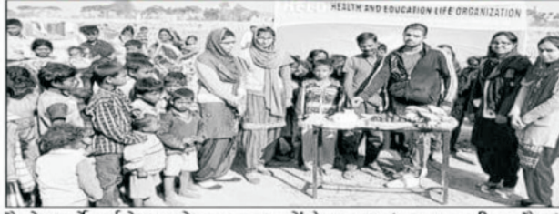
हेलो आर्गनाइजेशन के सदस्य बच्चों के साथ।