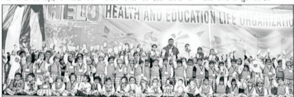
ਹੈਲੋ ਏਂਡ ਏਜੂਕੇਸ਼ਨ ਲਾਈਫ ਆਰਗੇਨਾਈਜ਼ੇਸ਼ਨ ਦੁਆਰਾ ਆਬਾਨ ਪਬਲਿਕ ਸਕੂਲਾਂ ਵਿੱਚ ਪੌਡਮ ਅਤੇ ਬਾਲਗੀਤ ਪ੍ਰੋਗਰਾਮ ਦਾ ਆਯੋਜਨ ਕੀਤਾ ਗਿਆ।

ਲਗੇ। ਇਸ ਪ੍ਰੋਗਰਾਮ ਵਿੱਚ ਬੱਚੇ ਮੁਕਾਬਲੇ ਵਿੱਚ ਹਿੱਸਾ ਲਿਆ। ਇਸ ਆਯੋਜਨ ਦਾ ਮਕਸਦ ਸ਼ਾਇਦ ਹੈ ਕਿ ਬੱਚੇ ਮੁਕਾਬਲੇ ਦੀ ਭਾਵਨਾ ਪੈਦਾ ਕਰਨ ਤੇ ਜੋ ਬੱਚੇ ਪੜ੍ਹਾਈ ਵਿੱਚ ਜ਼ਿਆਦਾ ਮਨ